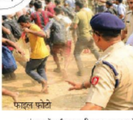
बंगाल में अर्धव्युपहृति इस तरह भारोस दिखाई दे रहे

उत्तर 24 परगना जिले का बस्तीरहाट क्षेत्र, जो बांग्लादेश सीमा से सटा हुआ है, यहाँ सबसे अधिक संदिग्ध लोगों की पहचान हुई है। यहाँ बांग्लादेशी नागरिकों और यौधिया समुदाय के लोगों के होने की आशंका है। ये होल्डिंग सेंटर अलग-अलग पुलिस स्टेशनों और प्रशासनिक जिलों में स्थापित किए जा रहे हैं। इनमें बस्तीरहाट, सुदूरगम, बस्तीरहाट, जोगीपुर और कुष्माण्डर शामिल हैं।